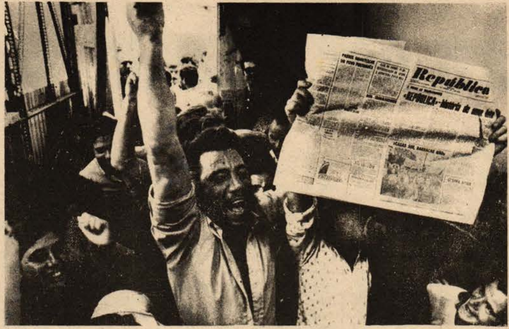
Komünist işçiler gazeteyi devraldıktan sonra

Türkiye basını ve TRT, Portekiz'deki gelişmeler üzerine susmaya, veya yanlış haberler vermeye devam ediyor. Oysa Portekiz'de son on gündür olup bitenler Avrupa'nın çehresini birden olağanüstü değiştirmeye adaydır. 48 yıllık faşizmi yıkan demokratik bir hareketten bir yıl sonra, Portekiz işçi sınıfı, kendine özgü olan ama dikkat edildiğinde sosyalizmin evrensel ilkeleri ile tam bir uyum gösteren bir yoldan, sosyalizme doğru gitmektedir. Son on gün içinde bir yıllık devrimci sürecin gerçek bir nitel sıçrama dönemine girdiği söylenebilir.