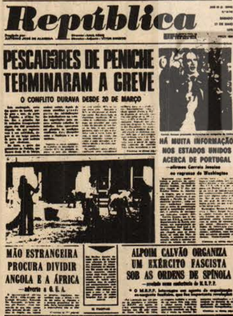
Olaylara yol açan Republica gazetesinin Sosyalist Parti'nin organı olarak çıkan son sayısı.

Sosyalist Parti bu kararlara kesinlikle karşı çıktı. Hele bu arada Republicanın, komünist işçilerden oluşan yeni bir yönetim kadrosuna devredilmesi üzerine iki milyon ikiyüz bin oyu temsil ettiğini ve Silâhlı Kuvvetler hareketinin totaliter bir rejime geçme hazırlıkları içinde olduğunu ve ne bahasına olursa olsun mücadele edeceğini ileri sürerek 11 Temmuz'da hükümetten bütün bakanlarını çekti. Bu sırada ülkenin